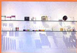
ディスプレイの見た目も美しい。男性用品の充実ぶりは、ミラノ随一だ。

豊かな香りでバスタイムを演出できる「this works」。インテリゲンシア。数種の香りが選べる。