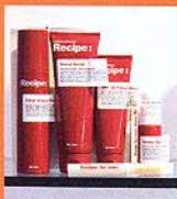
上:スウェーデンのコスメブランド「Recipe」。男性用基礎化粧品からシワ伸ばしクリーム、コンシーラーまで揃う。右:ラボのような店内。

未来的な雰囲気の漂う店内では、スキンドクターと呼ばれるスタッフが肌の悩みなどの相談に乗ってくれて、基礎化粧品から最先端のケミカルコスメまで各人に最適な商品をセレクトしてくれる。男性でも気軽にお試し可能だ。化粧品のほか、バス用のエッセンシャルオイルやシャワージェルなども充実。このショップの登場で、きれいな男性がますます増えそうだ。