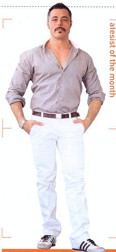
atesist of the month

SEVEN CASA DEI CILIEGI Via Luigi Bertelli 4 ☎02-2615190 M GORLA 🕒19時~24時 📅日 www.sevengroup.it