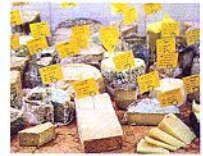
150種類以上のチーズが置かれたコーナー。選んだチーズはその場でカットして味わかる。好みのチーズを探す楽しみもひとしお。

左:320gのリブアイステーキ14.8ユーロ。肉質と量に感動だ。右:ミックスサラミ8.75ユーロ。オーナーが足で集めたサラミには季節限定品も。