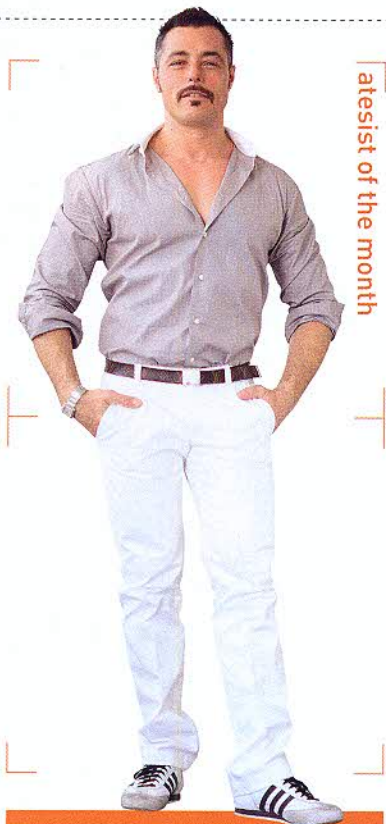
atesist of the month

SEVEN CASA DEI CILIEGI Via Luigi Bertelli 4 ☎02-2615190 M GORLA 🕒19時~24時 📅日 www.sevengroup.it