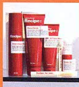
上:スウェーデンのコスメブランド「Recipe」。男性用基礎化粧品からシワ伸ばしクリーム、コンシーラーまで揃う。右:ラボのような店内。

未来的な雰囲気の漂う店内では、スキンドクターと呼ばれるスタッフが肌の悩みなどの相談に乗ってくれて、基礎化粧品から最先端のケミカルコスメまで各人に最適な商品をセレクトしてくれる。男性でも気軽にお試し可能だ。化粧品のほか、バス用のエッセンシャルオイルやシャワージェルなども充実。このショップの登場で、きれいな男性がますます増えそうだ。