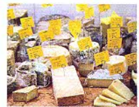
150種類以上のチーズが置かれたコーナー。選んだチーズはその場でカットして味わかる。好みのチーズを探す楽しみもひとしお。

左:320gのリブアイステーキ14.8ユーロ。肉質と量に感動だ。右:ミックスサラミ8.75ユーロ。オーナーが足で集めたサラミには季節限定品も。