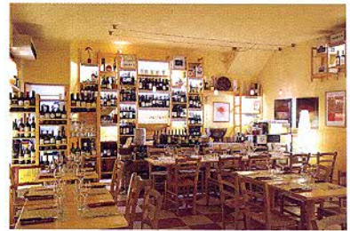
壁の棚に並ぶワイン。値段もかなりリーズナブルだ。